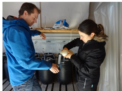
Gyllelaboratorium, her afprøves effekten af mælkesyre. (klik på billedet for stor udgave)

I projektet er der afprøvet tre nye teknologier, som kan reducere kvælstoftabet fra malkekvægsstalder: Gylleforsuring af spaltegulvarealet med fortyndet eddikesyre, skum på overfladen af gyllelaget i gyllekanalen og forsuring af kvæggyllen med mælkesyre i gyllekanalen. Effekten af disse tre teknologier er afprøvet i tønders i et gyllelaboratorium i 2012 (billede). Til afprøvningen er der brugt frisk økologisk kvæggylle med en pH tæt på 7, hvor ammoniakfordampningen er målt en gang i timen. Mælkesyre har dog ikke umiddelbart vist så markant en reduktion i fordampningen samt har tydet på at være for dyr en løsning, og vil derfor ikke blive omtalt videre i denne artikel. Dog bliver nye metoder med tilsætning af mælkesyre til gyllen afprøvet over efteråret 2012.